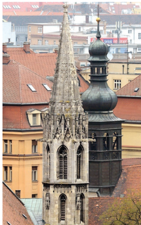
Z tejto veže Františkánskeho kostola oznamovalo ranné zvonenie čas otvárania a večerné zvonenie čas zatvárania výčapov. Preto sa mu hovorilo „Pivný zvon“.

Aj samotné vinárstvo sa začalo skôr. Máme o tom doklady, napríklad vinohradnícke nožíky zo Smoleníc, ktoré sú