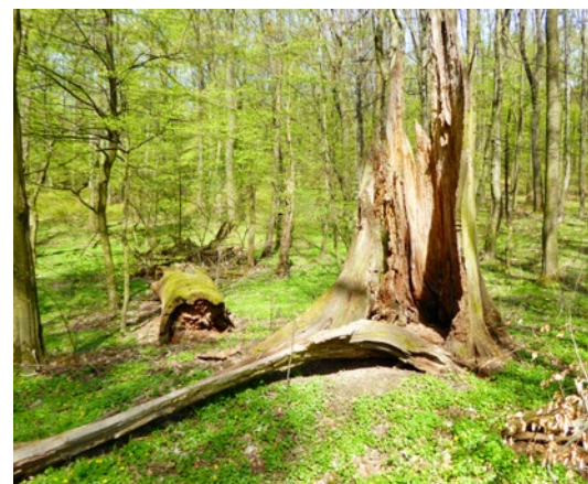
Torzo hraničného duba, Kačín

né úvozy vyznačené aj hraničníkmi pri ceste z Kačina do Lamača, hraničné jarky v petržalskom Jeleňom háji, či na hranici s Račou. Rozhraničovacie vodné línie tvoril najmä Dunaj, ale aj Vydrica, Lamačský či Karloveský potok. Práve pri Vydrici a Lamačskom potoku sa zachovali hraničné kopčeky.