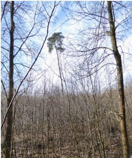
Hraničná borovica v Hornej Mlynskej doline