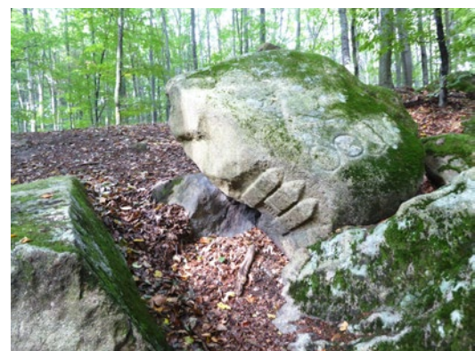
Kačín – Písaný kameň 14 – 1600

Z iných než kamenných historických hraničných znakov na území Bratislavy môžeme dodnes pozorovať torzo 300-ročného duba na Kačine, historické hranič-