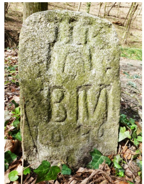
Cesta mládeže (HK 4 BM)

Jana Škutková v spolupráci s autorom publikácie