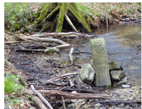
Hraničný kameň vztýčený vo Vydrici (HK 85 - 6)