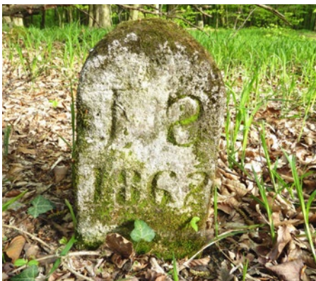
Spariská (MK.J.S. 1862)

Viditeľné hraničné kamene nájdeme na okraji záhradkárskej osady predstavujúcej