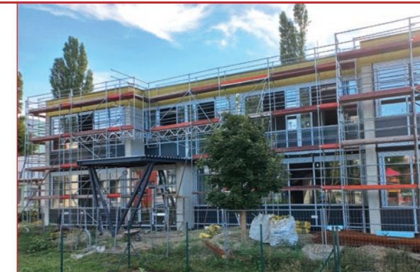
Nový pavilón s učebňami vzniká pri ZŠ Odborárska