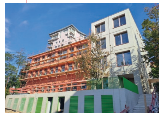
Nadstavba a prestavba rozšíri kapacitu ZŠ Cádova

„Podporili sme celkovo 11 projektov v mestských častiach hlavného mesta a 15 škôl v obciach a mestách Bratislavského kraja. Samosprávy môžu rozšíriť svoje kapacity, vybudovať nové triedy, zmodernizovať budovy a zlepšiť študijné podmienky pre žiakov. Vďaka eurofondom v kraji vznikne 4 265 no-