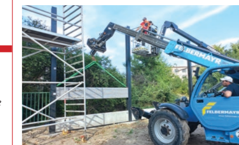
Instalácia protihlukovej steny za ZŠ Odborárska